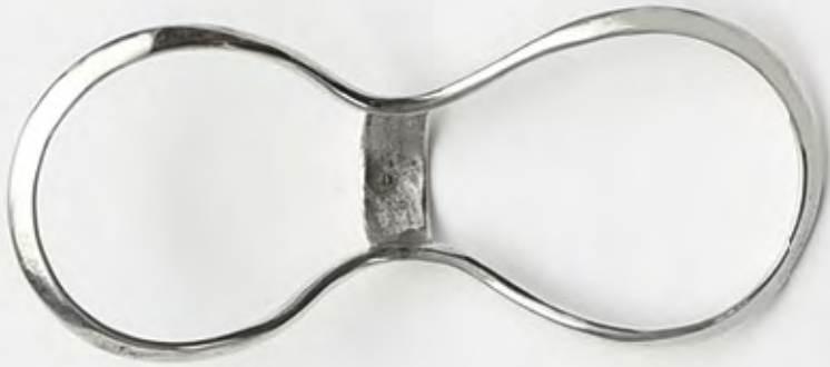
ΠΟΡΠΗ χειροποίητη, από ασήμι 6,5×2,5 εκ.